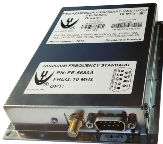
Рисунок 1 – Общий вид СЧ

Схема пломбировки от несанкционированного доступа, обозначение мест нанесения знака поверки представлены на рисунке 2.